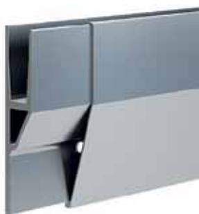
capot biseauté hauteur 238 mm