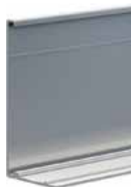
capot d'habillage côté extérieur hauteur 300 mm