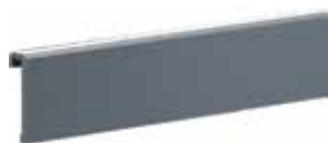
capot d'habillage côté intérieur hauteur 30 mm